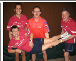
Diese Mannschaft wird uns fehlen