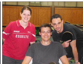
Meister und Überraschungsteam 2011/2012