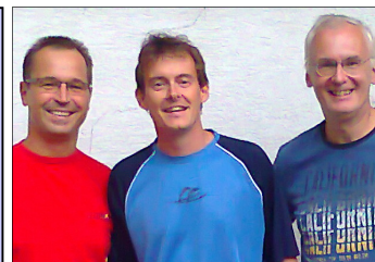
Erste Saison im WTTV